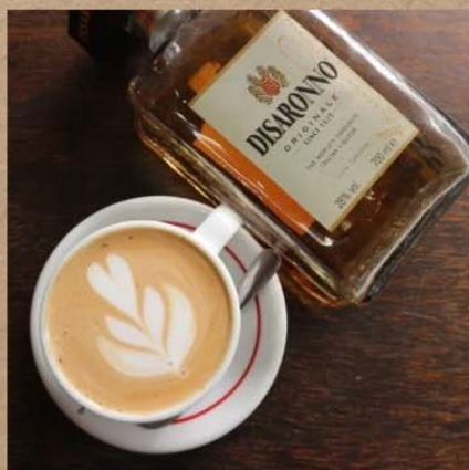
アマレットティーラテ ¥850-

至福のクリーミーラテ (Hot/Iced) ティーラテ (Hot/Iced) ドリップコーヒー (Hot/Iced) オレンジジュース グレープフルーツジュース トマトジュース ウーロン茶 (Hot/Iced) コーラ 炭酸水