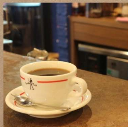
バレンタインブレンド ¥670-

ストロベリーとチョコレートの 組み合わせは相性抜群！ 甘いものが好きなお客様は 是非この機会に…！