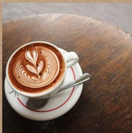
ストロベリーモカ ¥820-

濃厚なティーエスプレッソと アマレットを合わせました。 寒い冬に体が温まる ホットカクテルです、 ※アルコール入りです