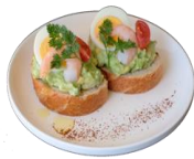
えびとアボカドのカナッペ 600yen 軽食にも、お酒のおつまみにもぴったり!