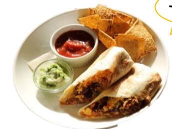
メキシカンブリトー

海老とアボカドを贅沢に。 見た目も食べごたえも大満足! 自家製ドレッシングと全粒粉の ふわふわバケットも相性抜群です。