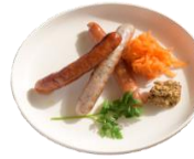
ソーセージ盛り合わせ 580yen パリッとジューシーな 三種のソーセージ。