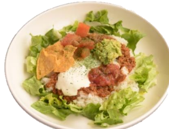
やみつきタコライス

じっくりコトコト煮込んで具材が やわらかに◎心も体も温まる一品。 パンとご飯で選べます。