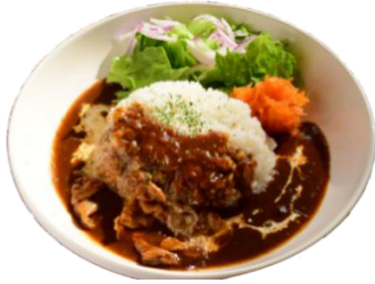
じっくり煮込んだ ビーフシチュー

じっくりコトコト煮込んで具材が やわらかに◎心も体も温まる一品。 パンとご飯で選べます。