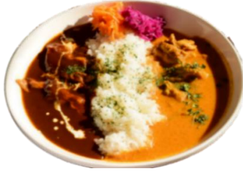
贅沢!!ビーフシチューと チキンカレーの合いがけ