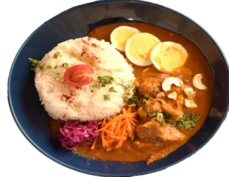
魅惑のチキンカレー