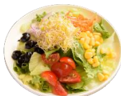
彩りミニサラダ セット 450yen 単品 680yen