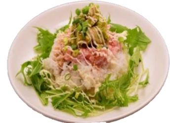
ネギトロアボカドご飯

リピート率NO.1!!!! ピリ辛でスパイスの香りがクセになる 原宿で1番売れてるタコライスです。