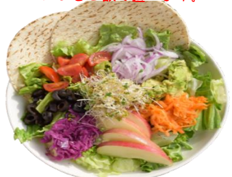
ヴィーガンパワーサラダ

6種類以上の野菜を盛り合わせました。 トルティーヤもグルテンフリー。 野菜は季節によって変更します。 ハーブソルトか自家製玉ねぎドレッシングで お味をお選びください。