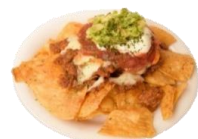
おつまみ人気No.1ナチョス 700yen やみつきになる自家製スパイシーミートを 使ったビールによく合うおつまみです。