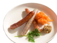
ソーセージ盛り合わせ