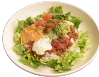
やみつきタコライス

じっくりコトコト煮込んで具材が やわらかに◎心も体も温まる一品。 パンとご飯で選べます。