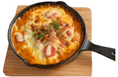
こんがりチーズの焼きカレー 温玉のせ

リピート率NO.1!!! ピリ辛でスパイスの香りがクセになる 原宿で1番売れてるタコライスです。