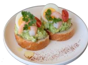
えびとアボカドのカナッペ