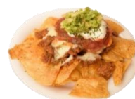
おつまみ人気No.1ナチョス 700yen やみつきになる自家製スパイシーミートを 使ったビールによく合うおつまみです。