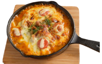
こんがりチーズの焼きカレー 温玉のせ

リピート率NO.1!!! ピリ辛でスパイスの香りがクセになる 原宿で1番売れるタコライスです。