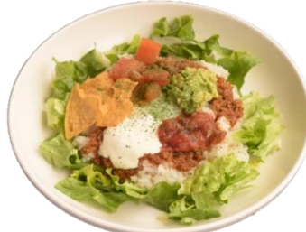
やみつきタコライス

じっくりコトコト煮込んで具材が やわらかに◎心も体も温まる一品。 パンとご飯で選べます。