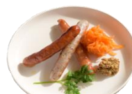
ソーセージ盛り合わせ