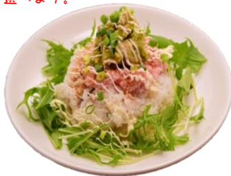
ネギトロアボカドご飯