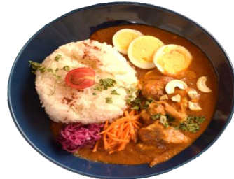
魅惑のチキンカレー