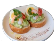
えびとアボカドのカナッペ