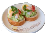
えびとアボカドのカナッペ