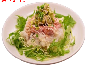
ネギトロアボカドご飯