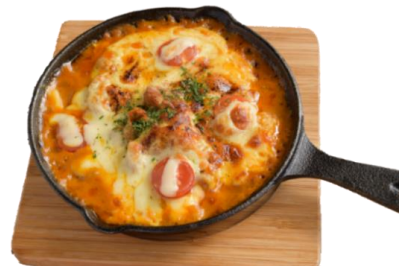
こんがりチーズの焼きカレー