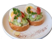
えびとアボカドのカナッペ