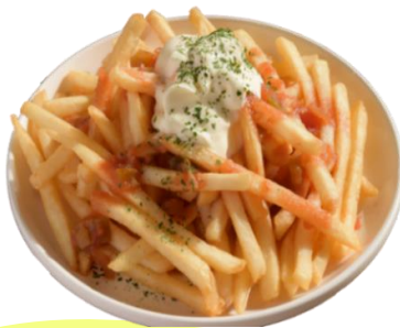
スイートチリポテト

見た目も食べても大満足のコブサラダ。 ハーフサイズのご用意もあります。700yen