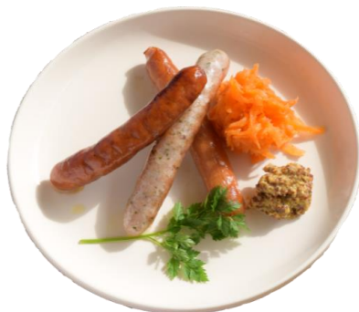
ソーセージ盛り合わせ