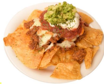
おつまみ人気No.1 ナチョス